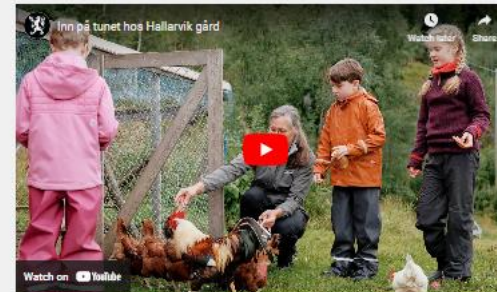
Inn på tunet hos Hallarvik gård, produsert av Dan Mariner og Cato Lauvli for Statsforvalteren i Nordland