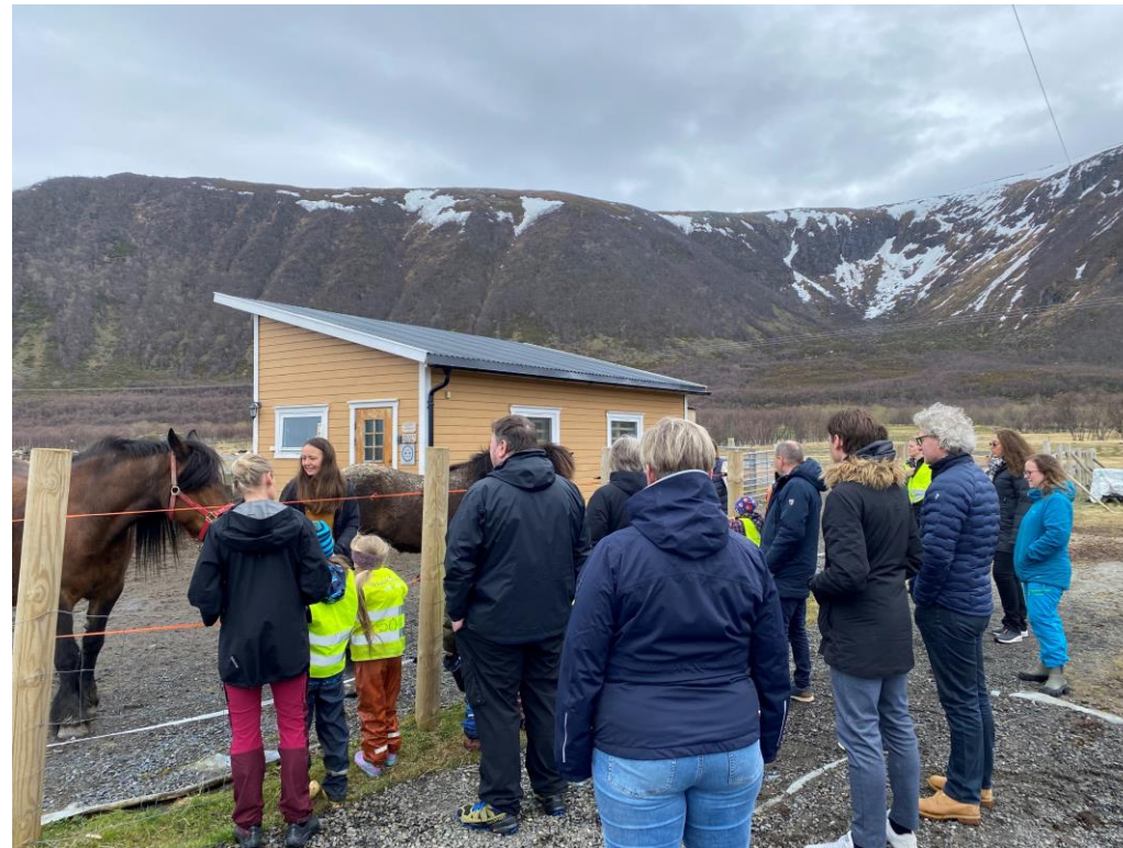
Formannskapet i Vågan kommune besøker Stall Fagerbakken sammen med Statsforvalterens prosjektgruppe.